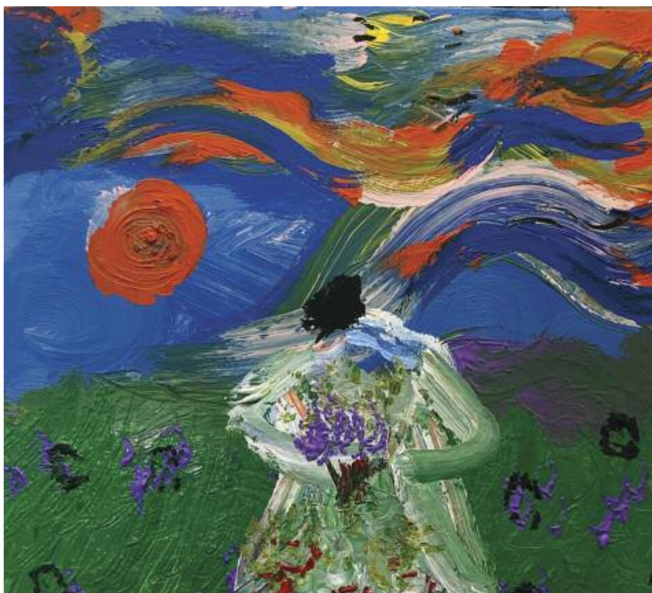
Poetica - acrilico su tela, cm 35x45