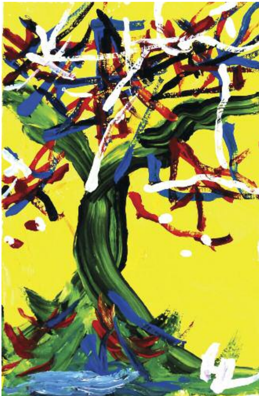
Giacomo Pietoso Opera n°4 dalla serie Gli alberi della vita acrilico su tela, cm 24x30

trastanti. Nelle sue opere prevale la deformazione di alcuni aspetti della realtà, così da accentuarne i valori emozionali ed espressivi. Il suo lavoro è caratterizzato dalla manifestazione diretta, tramite il segno e il colore, dell'esperienza emozionale e spirituale della realtà, così come la sperimenta l'artista. L'autore dipinge ciò che sente. Quindi possiamo dire che la sua è una tecnica