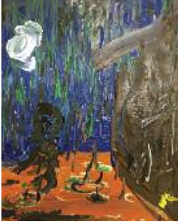
Ballando sotto la pioggia acrilico su tela, cm 24x30