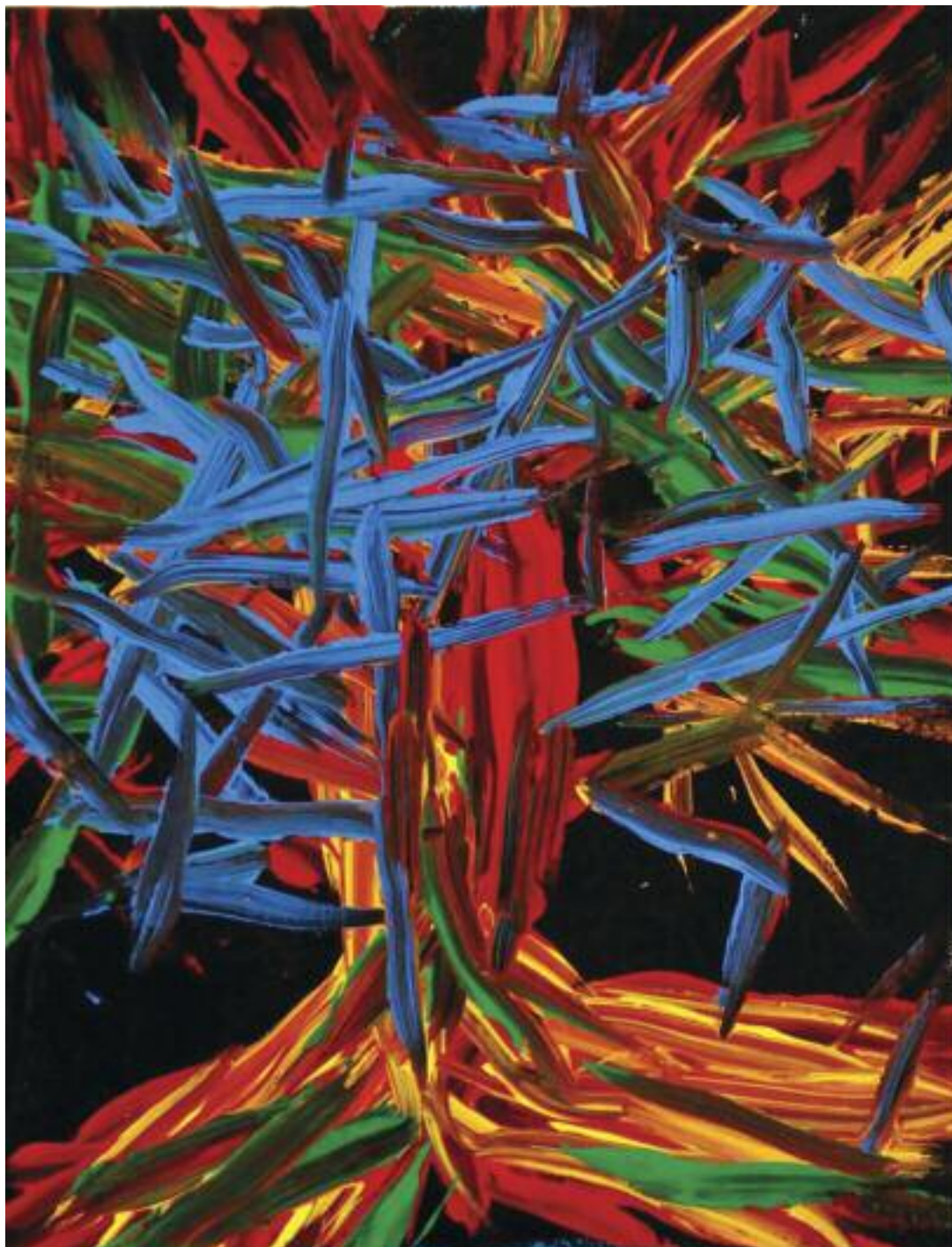
Giacomo Pietoso Opera n°1 dalla serie Gli alberi della vita acrilico su tela, cm 24x30

rispetto della realtà, anche se invece viene espresso il dramma attraverso la violenza cromatica e la deformazione della realtà. A tratti sembra percepire segni propri all'arte primitiva, spontanea ed istintiva, Nei suoi dipinti ci sono gradazioni di colore e sfumature capaci di creare ombre e volume, con tinte fortemente con-